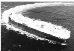
写真8.11 HUAL CAROLITA (資料-1301)