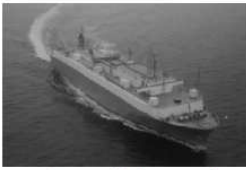
写真8.3 第十とよた丸 (資料-1020)