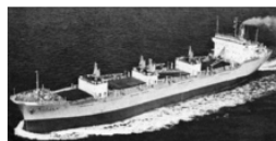
写真8.2 第一とよた丸