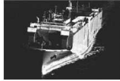
写真8.9 ひゅーむ はいうえい (資料-1043)