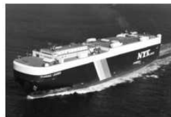
写真8.13 PHENIX LEADER

上記に示す様自動車専用船は、乗用車積載を基準に甲板配置を決めるのが一般的であるが、車高の異なる車種の積載台数の変化に対応出来る様、一部の甲板を