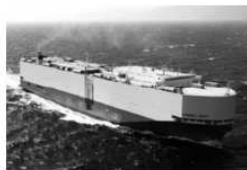
写真8.12 SUNBELT SPIRIT